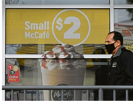
La chaîne, qui compte environ 40.000 établissements, vise quelque 1.400 restaurants supplémentaires dans le monde en 2022.

Le chiffre d'affaires du dernier trimestre s'est, certes, accru de 13%, porté par une augmentation des prix des menus dans son pays d'origine et par de « solides performances opérationnelles ». Avec aussi un contexte d'ouverture des établissements plus favorable que fin de 2020 dans des pays comme la France, le Royaume-Uni, l'Italie et